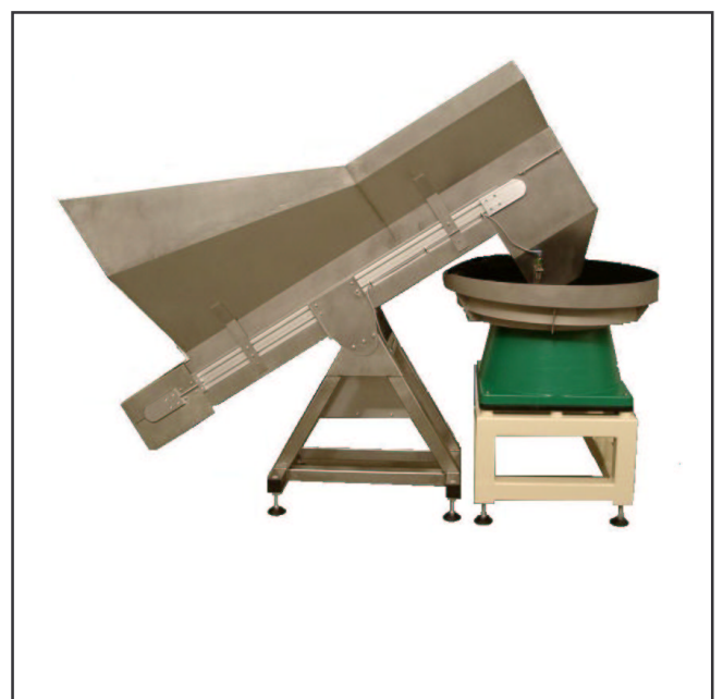
Figuur 2 : AAE bunkerband gecombineerd met een AAE trilvuller