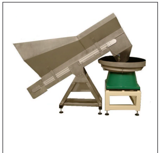
Bild 2 : AAE Schüttgutbunker in Verbindung mit einem AAE Vibrationsfördertopf